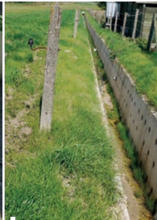
De uitwendige breedte van het element is slechts één meter, wegens de beperkte plaats achter de verkaveling. La largeur extérieure de l'élément est toujours d'un mètre, à cause de l'espace limité derrière le lotissement.