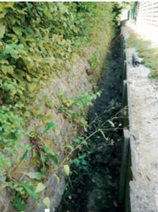
De oude afwateringsgrachten bestonden uit rechthoekige, enkelvoudige betonplaten. Les anciens canaux de drainage étaient constitués de simple plaques rectangulaire en béton.

PM: "We hadden wel degelijk een aantal specifieke voorwaarden voor de nieuwe gracht. Daarom vroeg ik tijdens een studiedag raad aan een vertegenwoordiger van Martens. We konden bijvoorbeeld niet met courante V-grachtelementen werken, wegens plaatsgebrek. Het nieuwe systeem moest uiteraard het water van de percelen en het regenwater opvangen, maar tegelijk wilden we ook tegemoet komen aan de hedendaagse trend om het oppervlaktewater terug te infiltreren in de bodem. Martens beton ontwikkelde een oplossing op maat, die intussen in