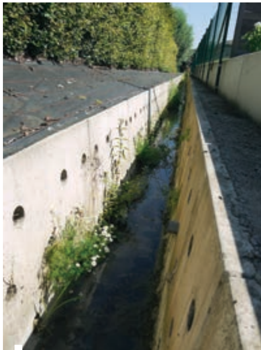
De door Martens beton ontworpen grachtelementen. Een belangrijke ontwerp eis was ook het 60cm brede bodemoppervlak, zodat de grachten machinaal kunnen schoongemaakt worden Les éléments de drainage développés par Martens béton. Les canaux devaient absolument faire 60 cm de large, afin de pouvoir être nettoyés manuellement.